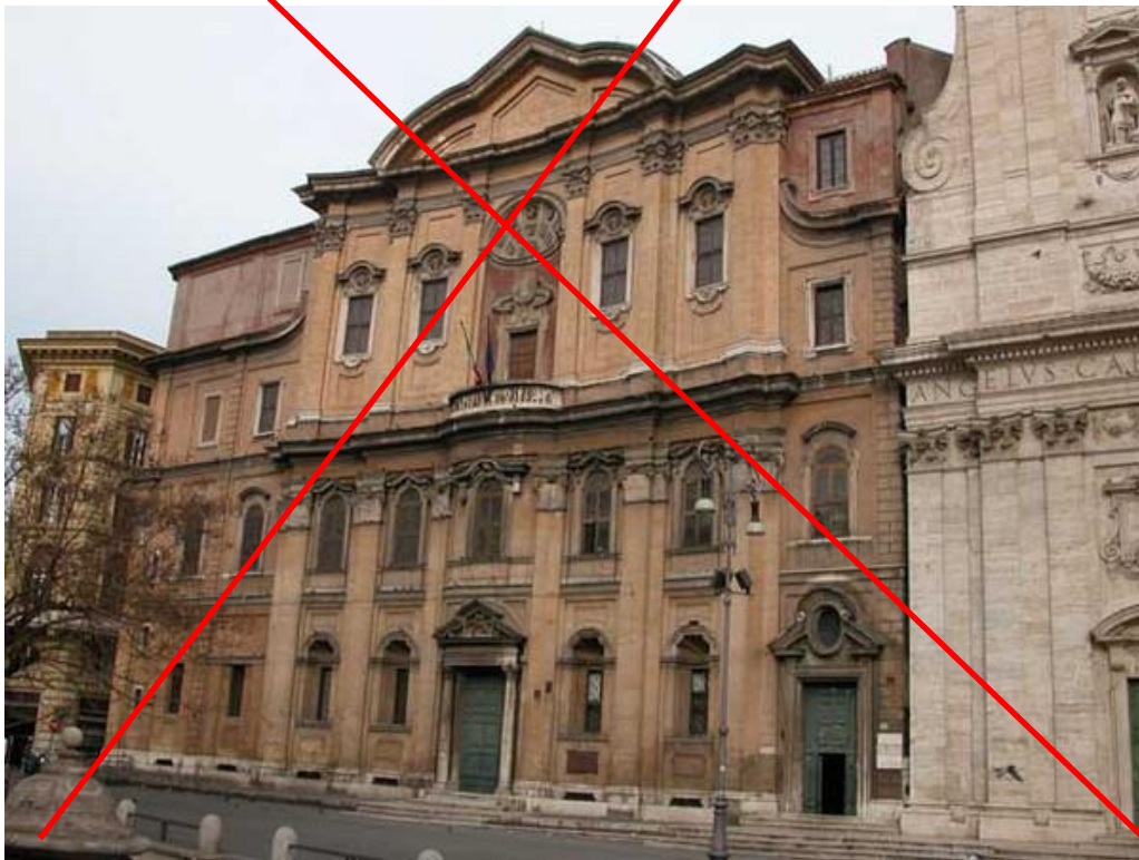
Il Palazzo dell'Oratorio dei Filippini, sede della Società romana di storia patria